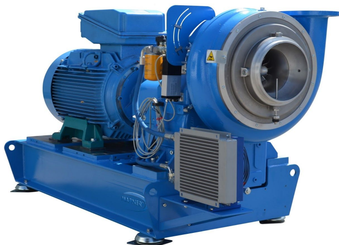
Modelo mostrado con configuración de motor con brida B5