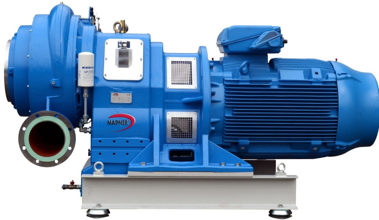
Modelo mostrado con configuración de motor con brida B5

TURBO SOPLANTE compresor de última generación con un rodete y diferentes terminaciones y sistemas de control que permiten adaptarnos a cada necesidad de trabajo y aplicación.