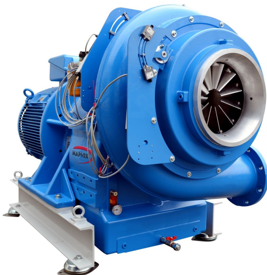
Modelo mostrado con configuración de motor con brida B5